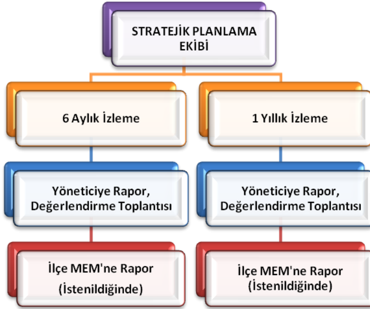
Şekil 8 Stratejik Plan İzleme ve Değerlendirme Modeli